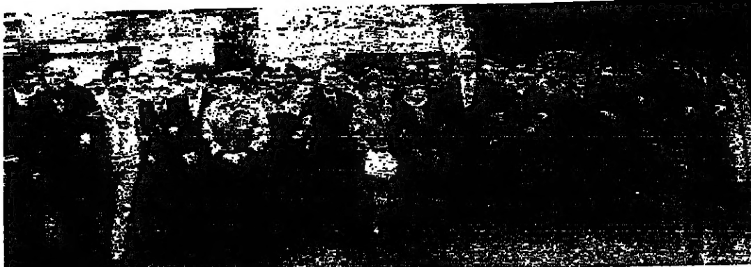
المسيره في شوارع بيروت الغربية (اسماعيل حداد)

تميز يوم الدفاع عن الحريات الاعلامية - امس بتضافر سيلي مع الصحافة اللبنانية وعبرت مسيره الاعلام الصامته عن هذا التضامن من خلال الجولة التي قام بها ولد مشترك من نقابتي الصحافة والحريرين، الى الرئيس ياسين الهراوي والرئيس حسين الحسيني والرئيس سليم الحص الذين اكدوا تضامهم مع الصحافة في معركة الدفاع عن الحريات.